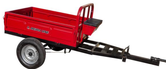
Remorcă 400 kg sau 500 kg