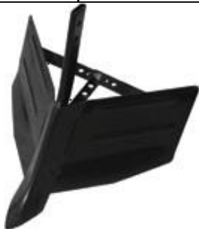
Accesoriu deschis rigole reglabil